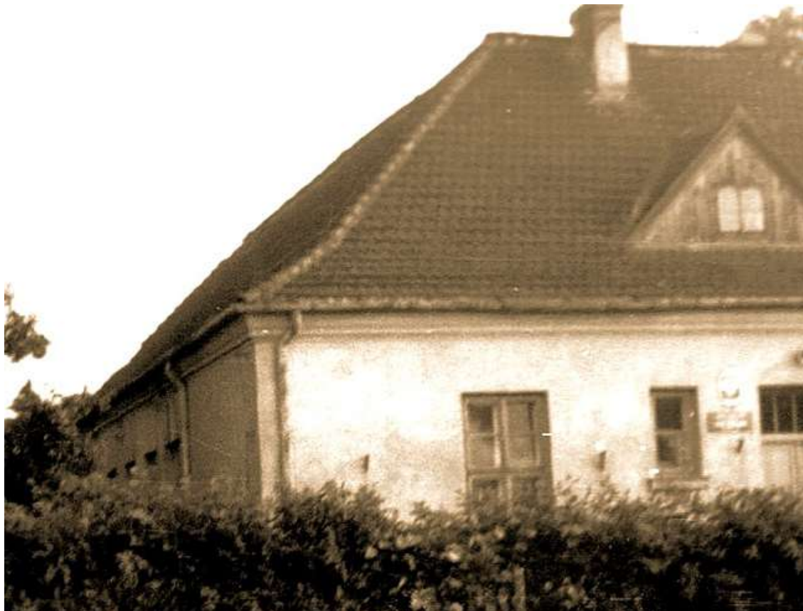
Szkoła Powszechna w Kusiętach - wygląd z lat międzywojennych.

Opracowanie graficzne i skład - Leszek Gryl