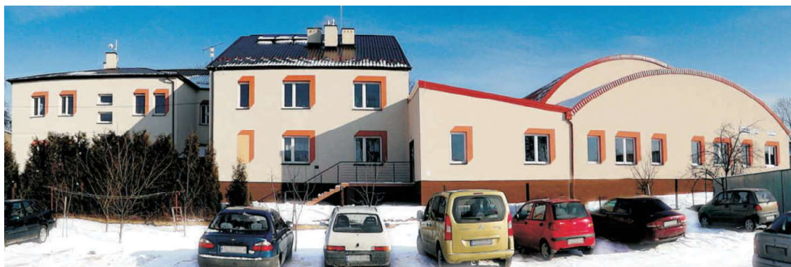
Szkoła Podstawowa im. Szlaku Orlich Gniazd w Kusiętach - wygląd współczesny po rozbudowie.