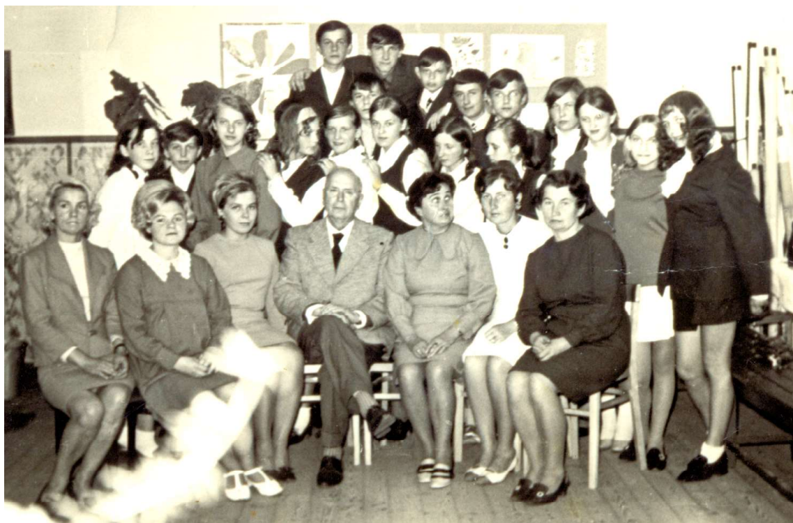
Nauczyciele szkoły w Kusiętach z uczniami. Rok szkolny 1970/1971.