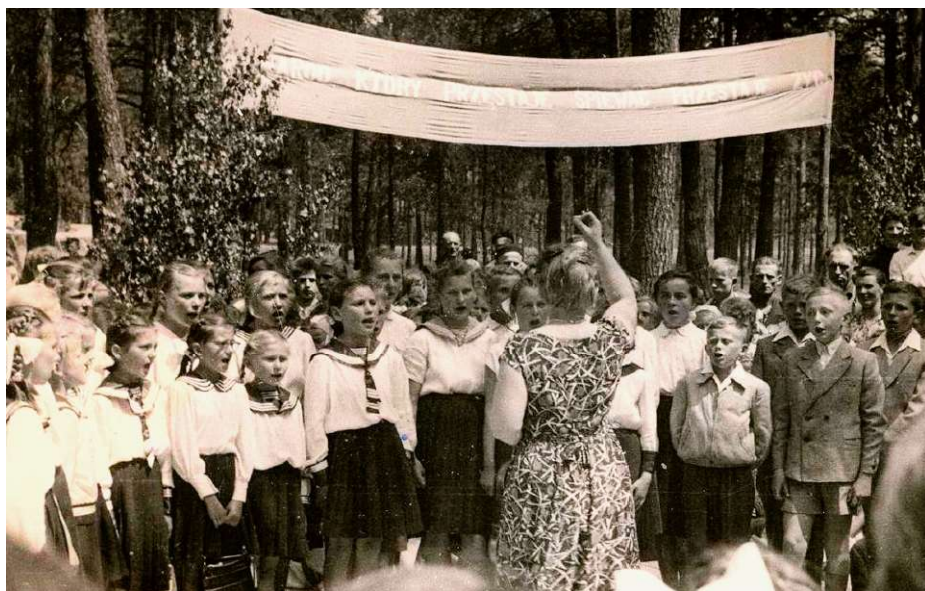
Święto Pieśni na „Zielonej Górze” w Kusiętach. Lata 60. XX wieku.